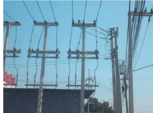
Visible Light Image